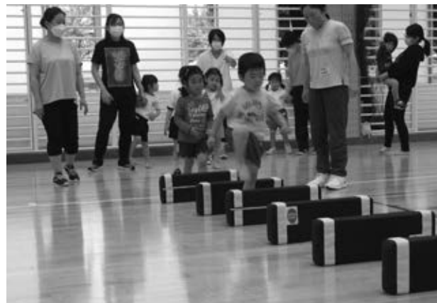
就園児親子体操教室