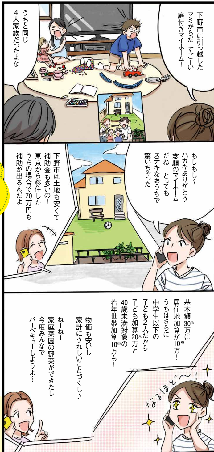
※定住促進住宅新築等補助金