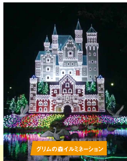
グリムの森イルミネーション