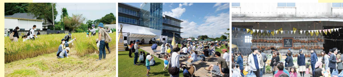
季節ごとにマルシェイベントや稲刈り体験、地域交流イベントも人気。