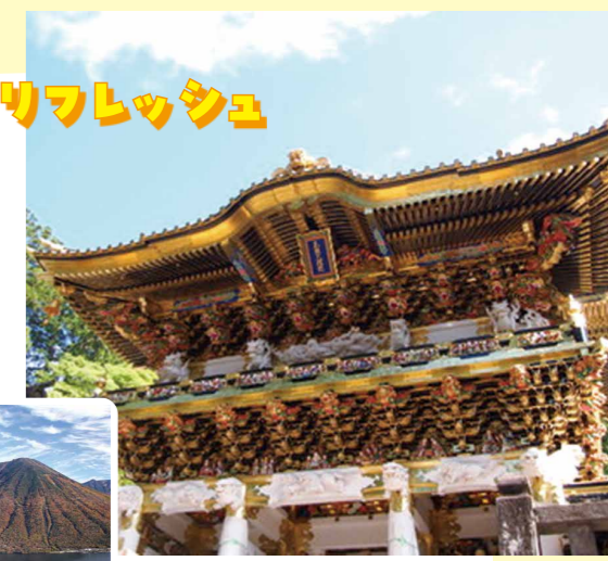
那須や日光をはじめ、良質な温泉で知られる鬼怒川や那須塩原も日帰り圏内なので、週末には家族や友人たちとさまざまなレジャーを楽しむことができます。