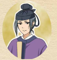
下野古麻呂 下野市出身の歴史上の人物