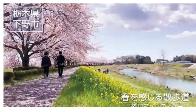
春を感じる散歩道 湯川アメニティパーク