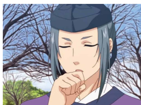
吉田地区をどんな風に 変えて行きたい？