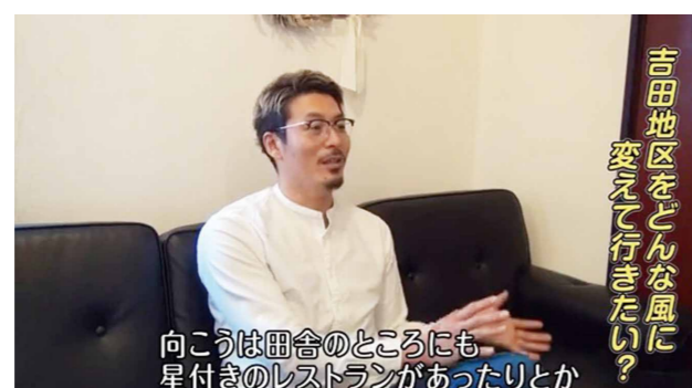
向こうは田舎のところにも星付きのレストランがあったりとか