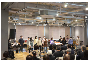
石橋北小の合唱団