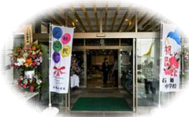
石橋小ののぼり旗

この複合施設には、公民館と児童館が入っており、乳幼児からお年寄りまで幅広い年代の市民が、生涯学習や児童福祉の拠点として利用することができます。