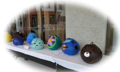
石橋中美術部のふくべ細工