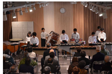
古山小の吹奏楽部