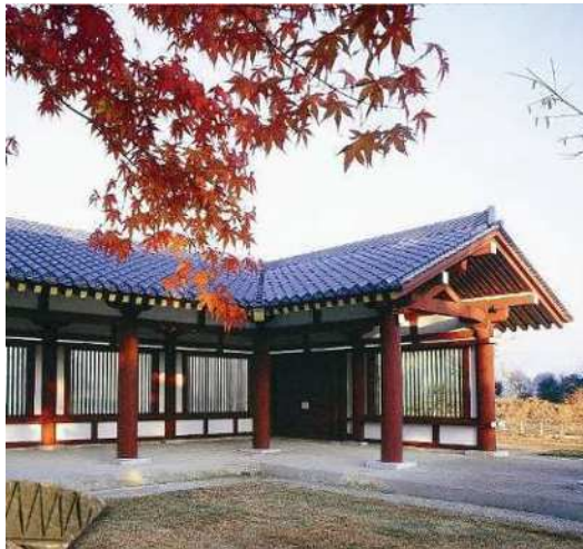
下野薬師寺復元回廊