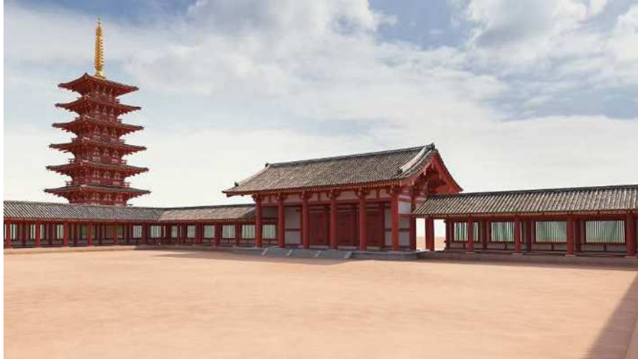
下野国分寺及び七重塔イメージ画像