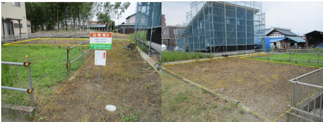
撮影地点 2 から

※ 写真中の黄線は、隣地との境をイメージしたものであり実際の境界線を示したものではありません。