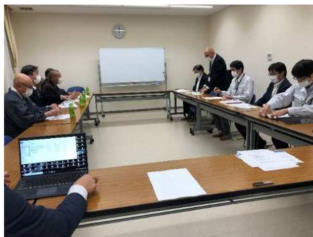
地元協議会との会議