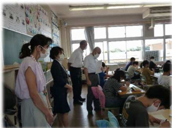
国分寺小学校での授業参観