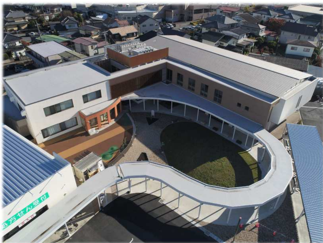
令和4年12月にオープンした石橋公民館(石橋複合施設)