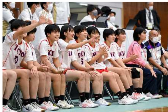
ハンドボール競技 (2)