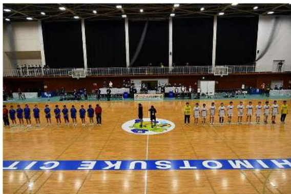
ハンドボール競技 (1)