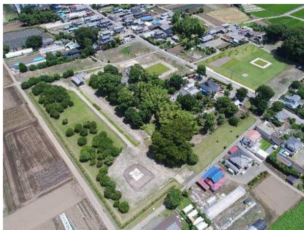
史跡下野薬師寺跡第3期保存整備対象区域