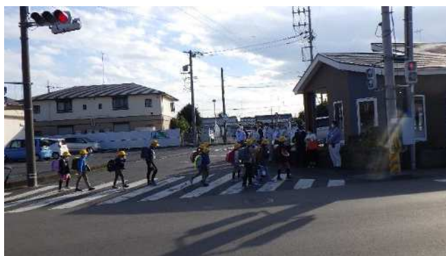
下野市通学路安全推進会議による現地確認