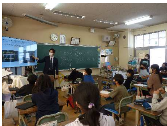
外部講師による食に関する指導の実施