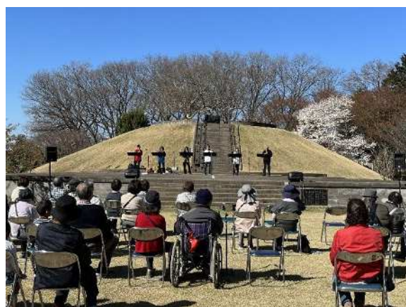
文化パフォーマンス