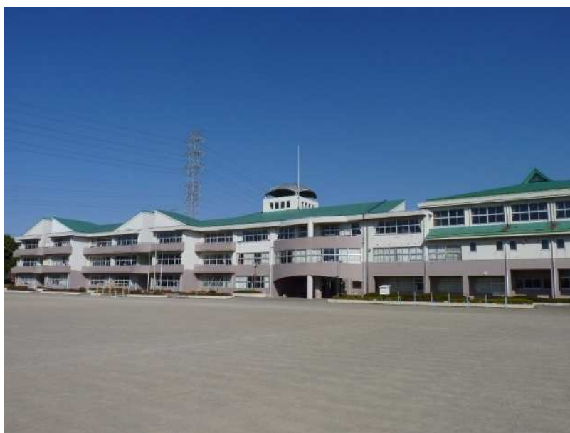
南河内第二中学校