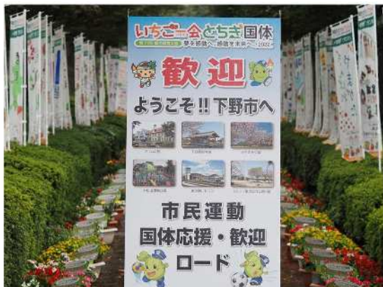
歓迎看板・PRのぼり旗

今後は、他市町の状況を見据え、県の「国体レガシー事業」の実施を検討したい。 すでに栃木県ハンドボール協会にはどのような催事ができるか、提案を求めている。