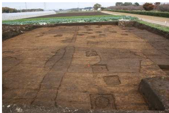
落内遺跡第4次調査区（南から）