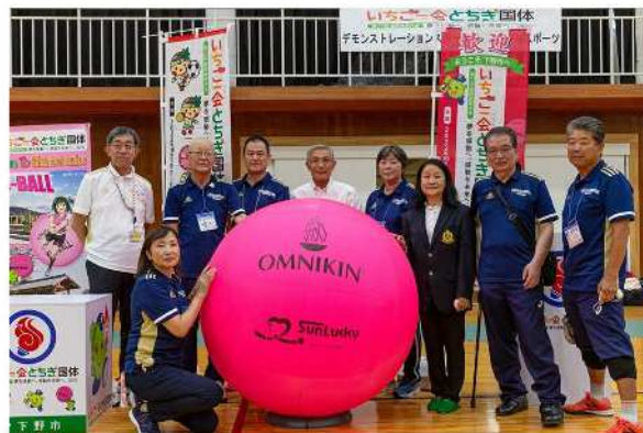
キンボールスポーツ