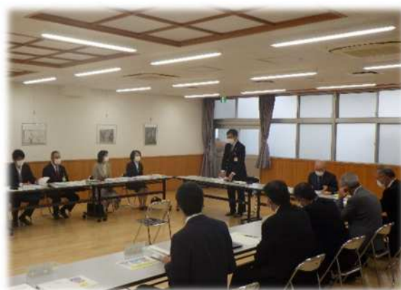
石橋小学校での出前教育委員会