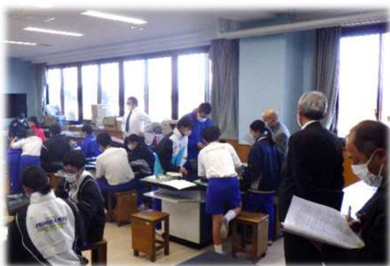
石橋中学校での授業参観