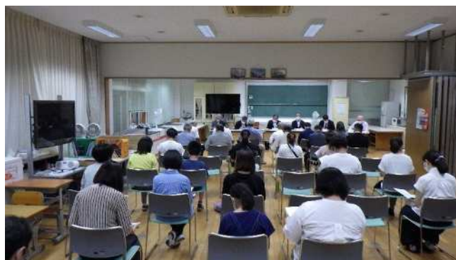
保護者・地域説明会