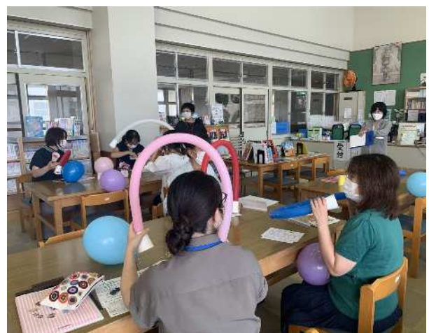
図書支援員研修会