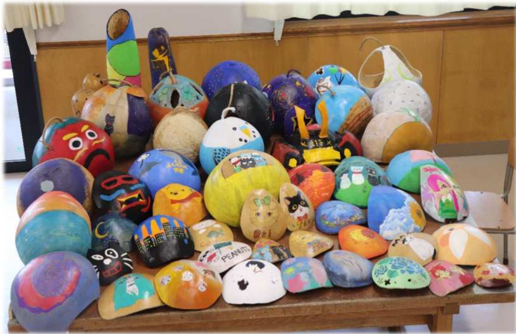
児童生徒が制作したふくべ細工