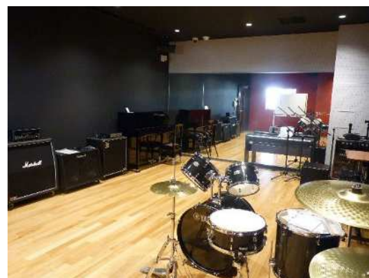
石橋公民館 音楽スタジオ