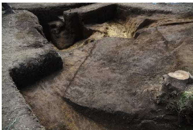
三王山南塚3号墳の東側周溝（北から）