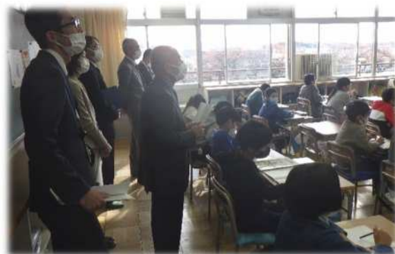
石橋小学校での授業参観