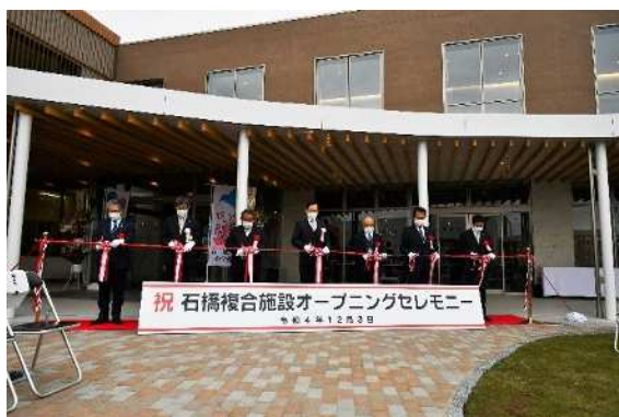
石橋複合施設オープニングセレモニー