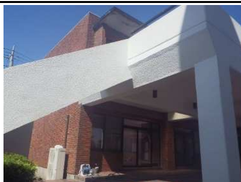
改修したスポーツ交流館