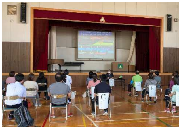
食物アレルギー研修会