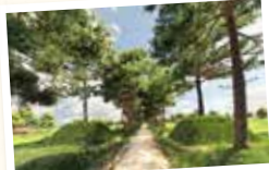
国指定史跡小金井一里塚

アプリのダウンロード 「App Store」または「Google Play」で検索