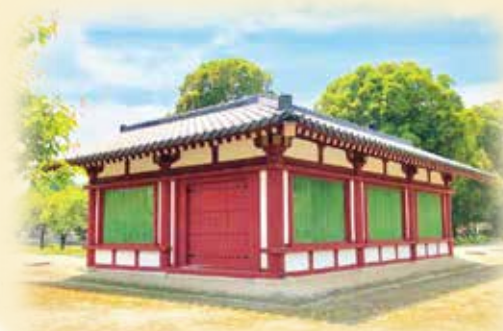
国指定史跡下野薬師寺跡復元回廊