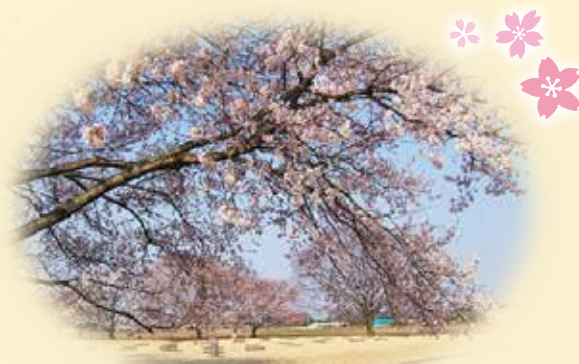
国指定史跡下野国分尼寺跡