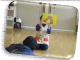
2月1日(木) 「節分あそび」