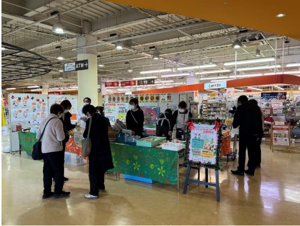
ヨークベニマル石橋店