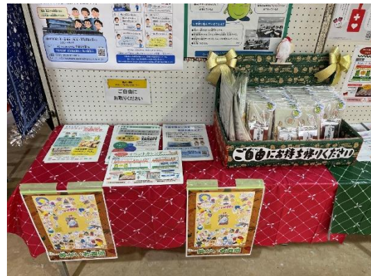
景品付きのチラシを配布