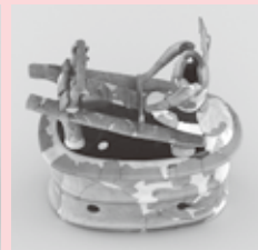
機織形埴輪2基（甲塚古墳出土）